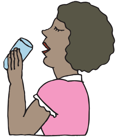
إشرب السوائل (الخالية من الكافيين) كل ساعة قدر المستطاع

يصعب السيطرة على مستويات سكر الدم عند الإصابة بالمرض. حتى المشاكل الشائعة مثل البرد أو القيء أو ارتفاع درجة الحرارة، يمكن أن تسبب مشاكل صحية خطيرة. فيما يلي بعض الأمور المهمة التي يجب تذكرها عندما تكون مريضاً: