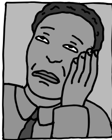
Debilidad o cansancio