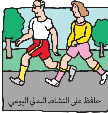
حافظ على النشاط البدني اليومي