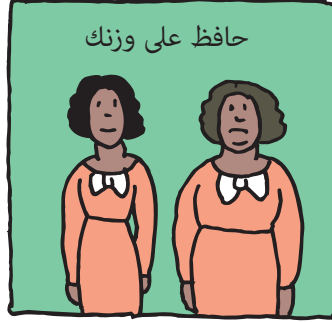
حافظ على وزنك