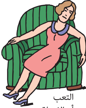
التعب أو الإرهاق

الأسباب الشائعة: تخطي الوجبات أو عدم تناول كمية كافية من الطعام؛ أخذ كمية كبيرة من الإنسولين أو أقراص علاج السكري؛ النشاط الشديد بشكل أكثر من المعتاد.