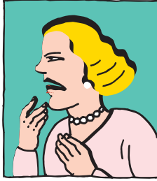
الانزعاج أو العصبية