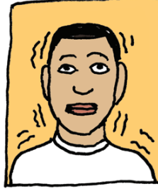
رعشة و الإحساس بالدوار